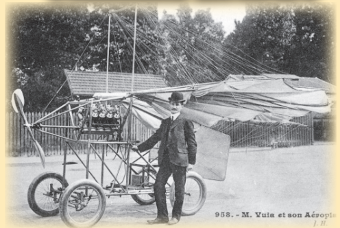
Traian Vuia - bănățeanul nostru de fală